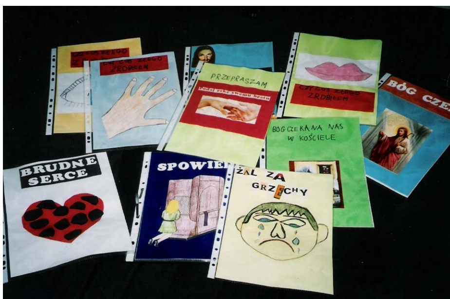
Fot. 2. Karty z albumu „Sakrament Pokuty”